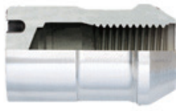
ホイールロックナット部分の断面図