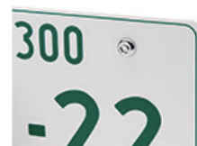
ナンバープレートロック