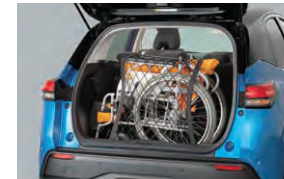
車いす固定用ゴムネット