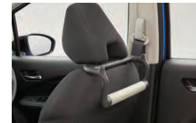
大型シートバックグリップ 〈運転席〉