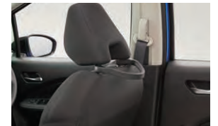
シートバックグリップ 〈運転席〉