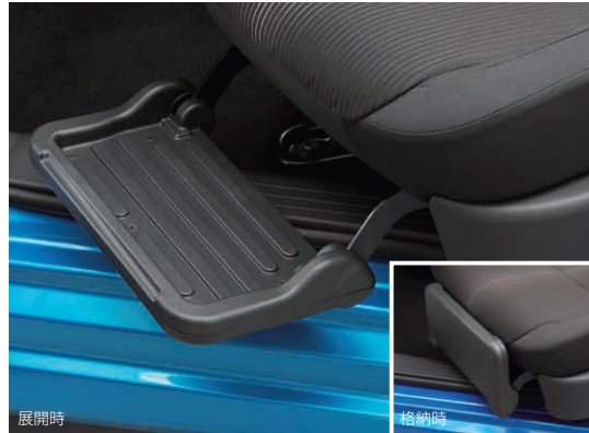
フットレスト フットレストに足を乗せればよりスムーズに乗り降りできます。