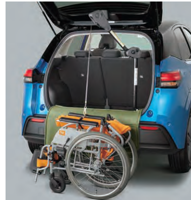
車いす収納装置(電動式)(2WD用) 吊り上げ能力30kg