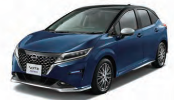
ボディカラーはオーロラフレアブルーパール(P)/スーパーブラック 2トーン(〈#XGN〉)特別塗装色【AUTECH専用色】。オプション装着車。