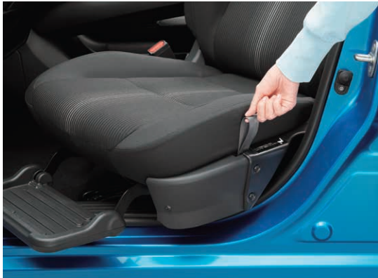
ストラップ ストラップを引くだけの簡単操作でシートを回転できます。