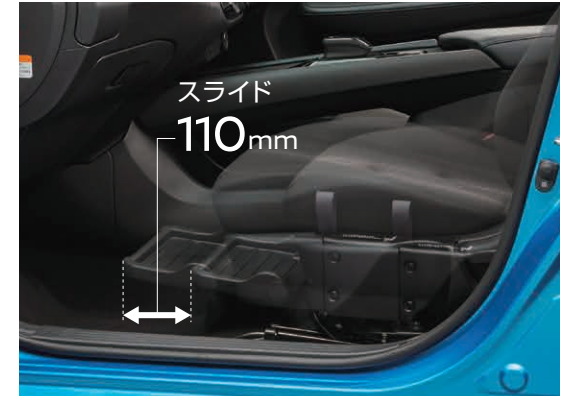
シートスライド 乗車中の足元スペースが広がり、ゆったりと座れます。 ※シート回転時にはスライド位置を最前端に合わせてください。