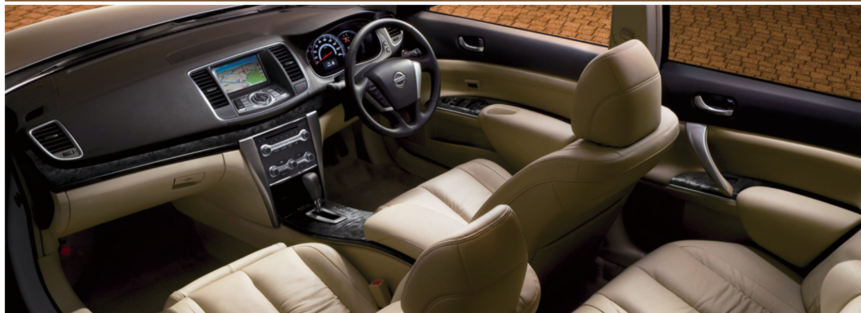
Silky Ecrú Interior