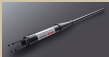
YAMAHA製パフォーマンスダンパー

Photo: アクシス (2WD・VQ25DE)。内装色はシルキーエクリュ(C) (上)/ブラック(G) (下)。プライバシーガラスはメーカーオプション。*画面はハメ込み合成です。