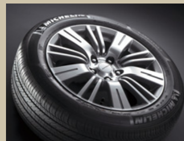
専用17インチアルミホイール& 215/55R17タイヤ<MICHELIN ENERGY MXV8>