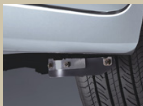
専用エアスパッツ (リヤ・左右)