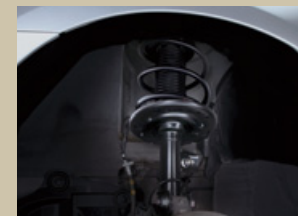
専用サスペンション

Photo: アクス(2WD・VQ25DE)。ボディカラーはブリリアントシルバー(M)(<#K23・スクラッチシールド)。キセノンヘッドランプ(ロービーム、オートレベライザー付)、プライバシーガラスはメーカーオプション。専用マフラー(左右2本出しタイプ)<FUJITSUBO製> & 専用リヤアンダープロテクターはオーテック扱いオプション。