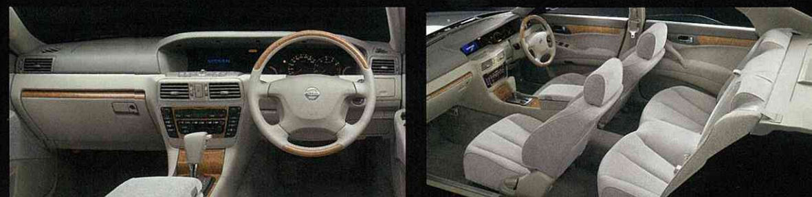
Photo(左):250AX。内装色はエクリュ<J>。Photo(右):250AX。内装色はエクリュ<J>。TV/ナビゲーションシステム(DVD方式、リモコン付)+DVDナビ標準ハンドフリー電話+VICS LEVEL1・2・3。ステアリングスイッチ(ハンドフリー電話用)、セドリックホログラフィックサウンドシステム(カセット一体AM/FM電子チューナーラジオ、CDオートチェンジャー<6連奏>、7スピーカー、160W)はセットでメーカーオプション。