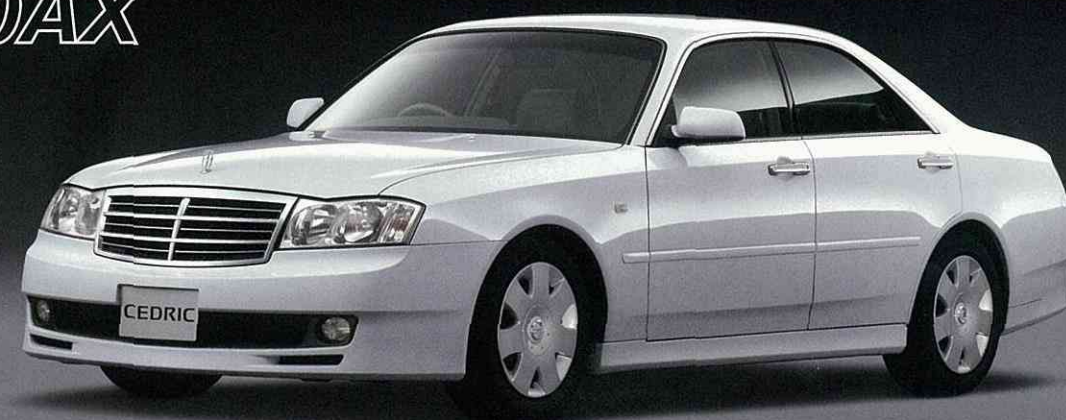
Photo:250AX。ボディカラーはダイヤモンドシルバー(M) <#KY0>。 ※250AXはエアロパーツ装着のため、縁石や段差の大きな場所や不整地路等では路面などと干渉する場合がございます。あらかじめご承知おきください。