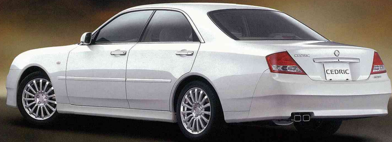
Photo:300AX。ボディカラーはホワイトパール(3P) <#OX1・特別塗装色>。 ※300AXはエアロパーツ装着のため、縁石や段差の大きな場所や不整地路等では路面などと干渉する場合がございます。あらかじめご承知おきください。