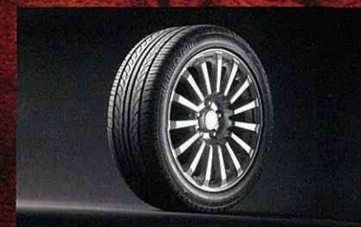
■225/45ZR17ラジアルタイヤ &専用17インチアルミロードホイール(300AX)