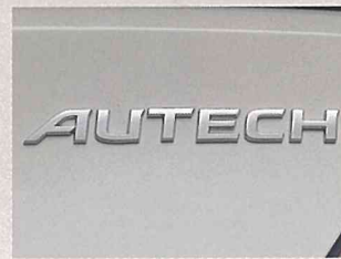
●専用リアエンブレム