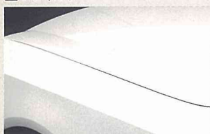
ホワイトパール (3TP) (＃QV3・特別塗装色)