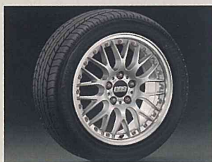
●235/45ZR17ラジアルタイヤ& BBS17インチアルミロードホイール

●TV/ナビゲーションシステム (DVD方式) & セドリックホログラフィックサウンドシステム、プライバシーガラスはメーカーオプション