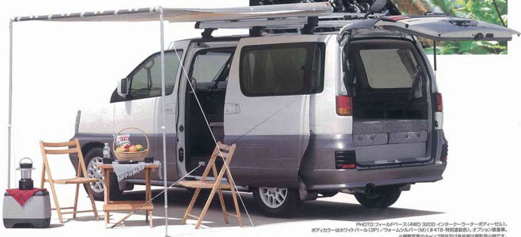
PHOTO:フィールドベース(4WD 3200 インタークーラーターボディーゼル)。 ボディカラーはホワイトパール(3P)/ウォームシルバー(M)(#4TB-特別塗装色)。オプション装着車。 ※掲載写真のキャンプ用品及び食品等は撮影用小物です。