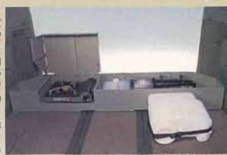
収納時(防火カバーははね上げ状態)

コンロはコンパクトな一体型ボックスに収納。はね上げ式防火カバー(スチール製)付きですので安心です。またコンロ横にちょっとした小物が入るフタ付き収納ボックスも装備。シンクは使用時のみ外に出せる組み立てタイプで給水・排水タンクはそれぞれ10リットルの容量を確保しました。 (排水タンクは空にして収納するタイプです。写真はシートをマルチアップさせた状態です。黒ラックサイドボックス(左右)は使用できません。)