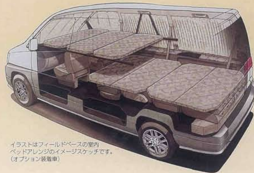
イラストはフィールドベースの室内 ベッドアレンジのイメージスケッチです。 (オプション装着車)