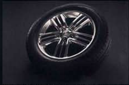
専用17インチ光輝アルミロードホイール(17×6.5JJ)