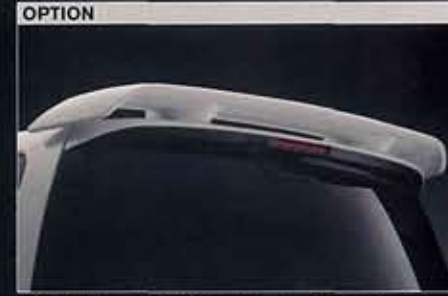
専用大型ルーフスポイラー(オーテック扱いオプション)