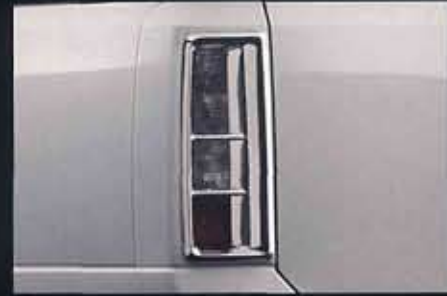
専用リヤウインターフィニッシャー