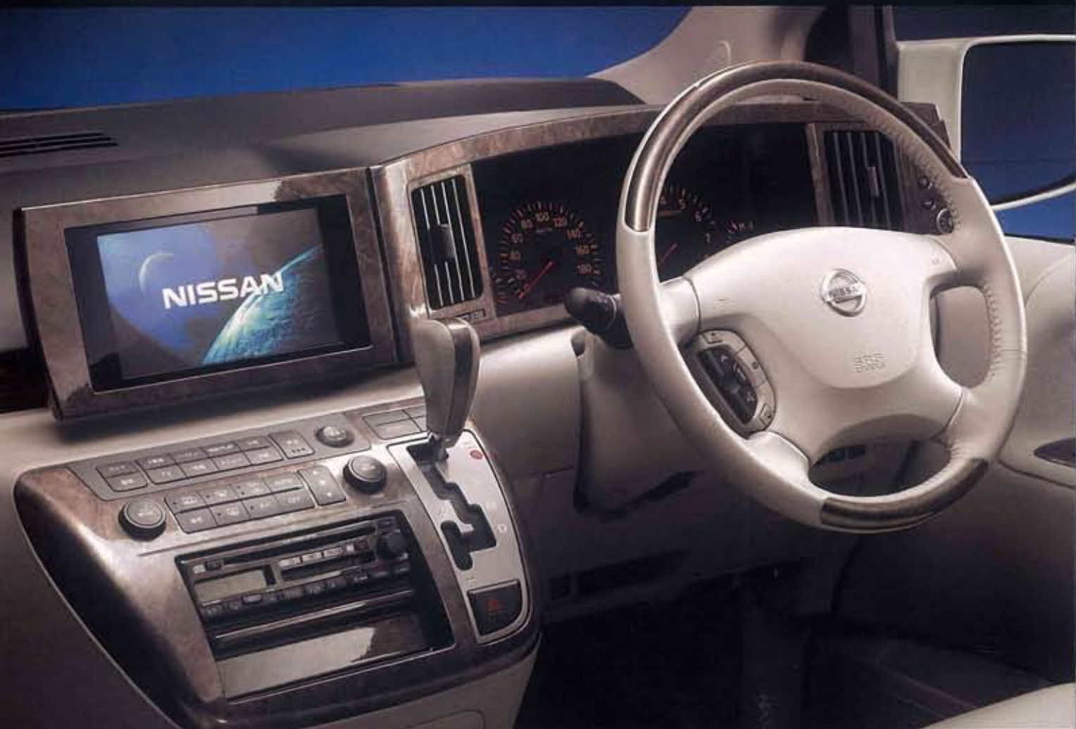
Photo: ライダー(2WD)。内装色はエクリュ(S)。カーウイングス対応ツインモニター-TV/ナビゲーションシステム(DVD方式)+インテリジェントキー+電源コンセント+バックビューモニターはメーカーオプション。前面はハメ込み合成です。