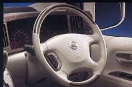
専用4本スポークステアリングホイール(本革巻・石目調)