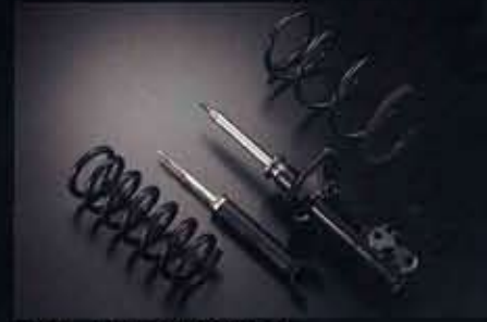
専用ローハイトサスペンション