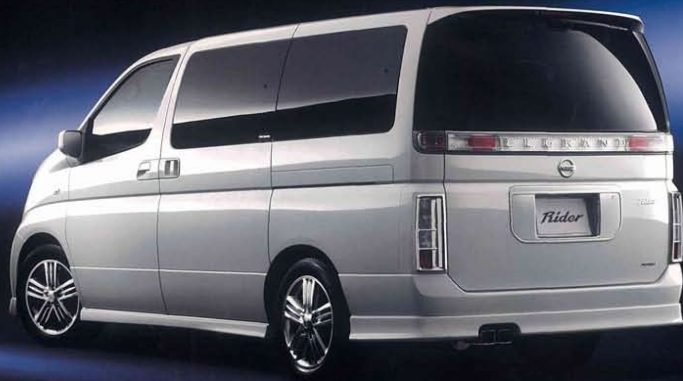
Photo: ライダー(2WD)。ボディカラーはホワイトパール(3P) (≠OX1) (特別塗装色)。カーウイングス対応ツインモニター-TV/ナビゲーションシステム(DVD方式)+インテリジェントキー+電源コンセント+バックビューモニターはメーカーオプション。