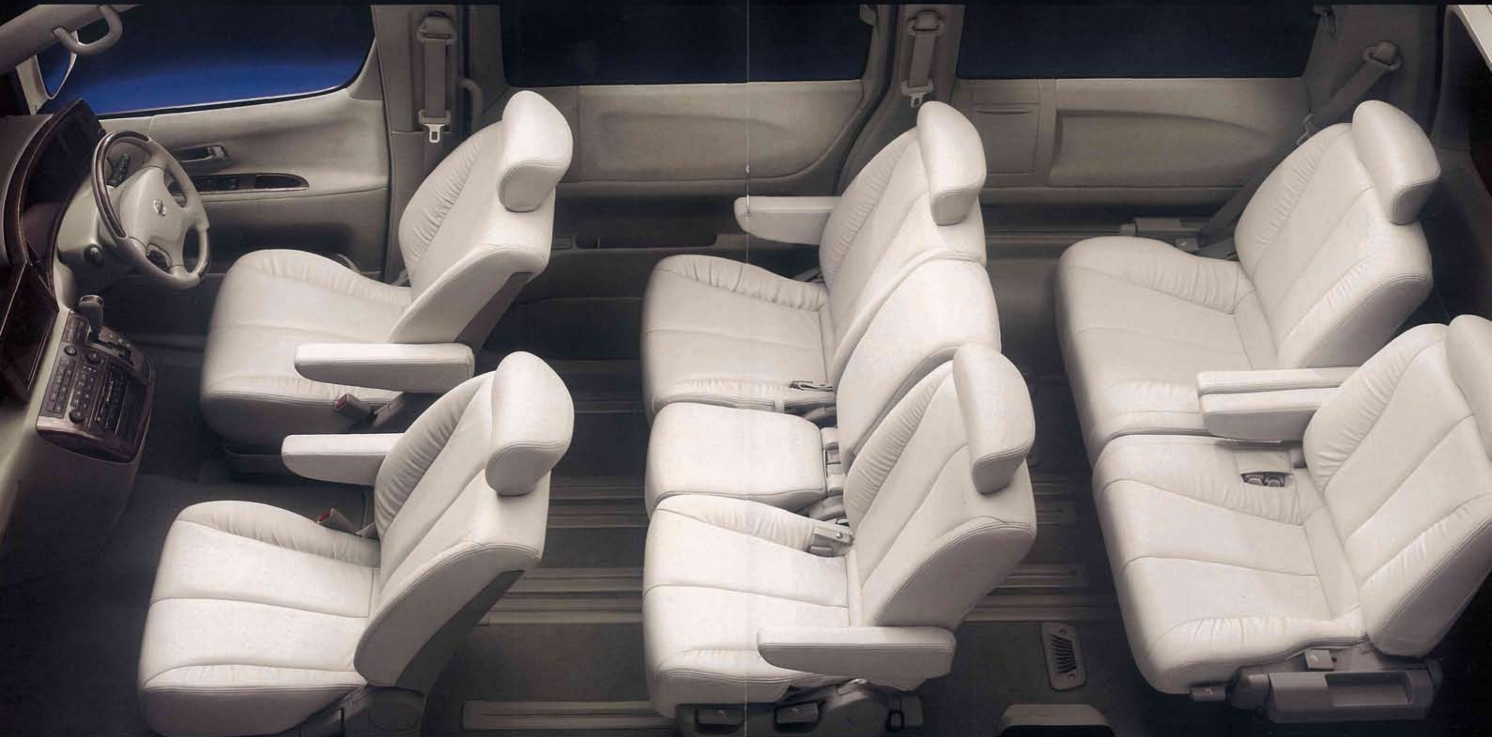
Photo: ライダー(2WD)。内装色はエクリュ(S)。 カーウイングス対応ツインモニターTV/ナビゲーションシステム(DVD方式)+インテリジェントキー+電源コンセント+バックビューモニターはメーカーオプション。

大人の贅沢を突き詰めた、ホワイト・ラグジュアリー。 洗練を昇華したこの空間には、格別な時が流れている。