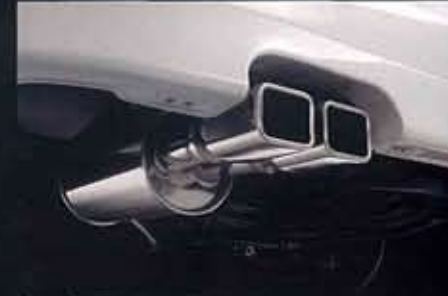
専用大口径スポーツマフラー(フジツボ技研製)