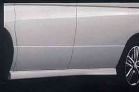
専用サイドシルプロテクター