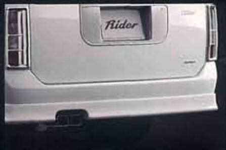
専用リアアンダープロテクター