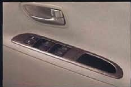
専用石目調フィニッシャー (写真はパワーウィンドウスイッチフィニッシャー)