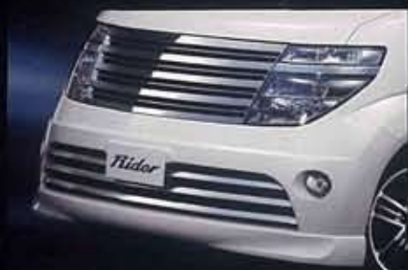
専用フロントバンパー&専用フロントグリル