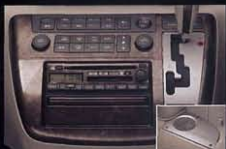
ライダー専用サウンドシステム ＜スーパークーラー＞