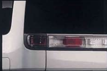
専用リアアッパーコンビランプ(クリアタイプ)