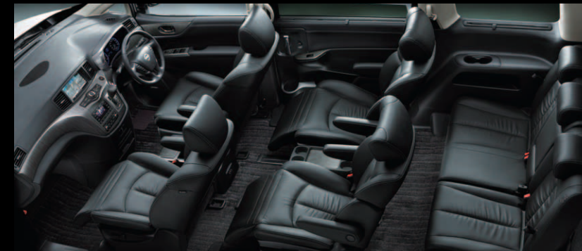
BLACK LEATHER SEAT