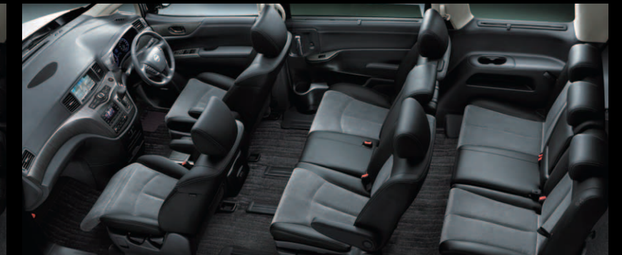
BLACK CLOTH SEAT

Photo(上):ライダー プレミアムホワイトレザーシート・パワーシート(2WD-VQ35DE・7人乗り)。ボディカラーはプリリアントホワイトパール(3P)〈#QAB・スクラッチシールド〉(特別塗装色)。Photo(左下):ライダー ブラックレザーシート・パワーシート(2WD-QR25DE・7人乗り)。ボディカラーはプリリアントホワイトパール(3P)〈#QAB・スクラッチシールド〉(特別塗装色)。Photo(右下):ライダー ブラッククロスシート・マニュアルシート(2WD-QR25DE・8人乗り)。ボディカラーはプリリアントホワイトパール(3P)〈#QAB・スクラッチシールド〉(特別塗装色)。共通装備:カーウイングスナビゲーションシステム+Bose 5.1chサラウンド・サウンド付 後席プライベートシアターシステム+エルグランド専用チューニング地デジ4ダイバーシティアンテナ+ETCユニット+専用ア라운드ビューモニター+ステアリングスイッチ+フロント&バックソナーはメーカーオプション。専用フロアカーペットはオーテック扱いディーラーオプション。※画面はハメ込み合成です。