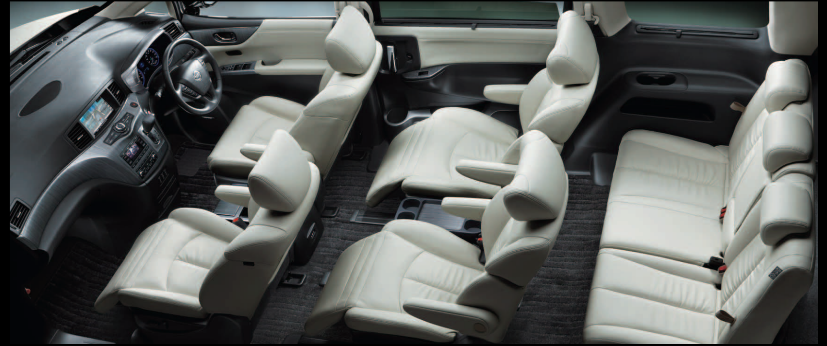
PREMIUM WHITE LEATHER SEAT〈メーカーオプション〉