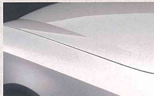
プラチナシルバー(M) (＃KLO)