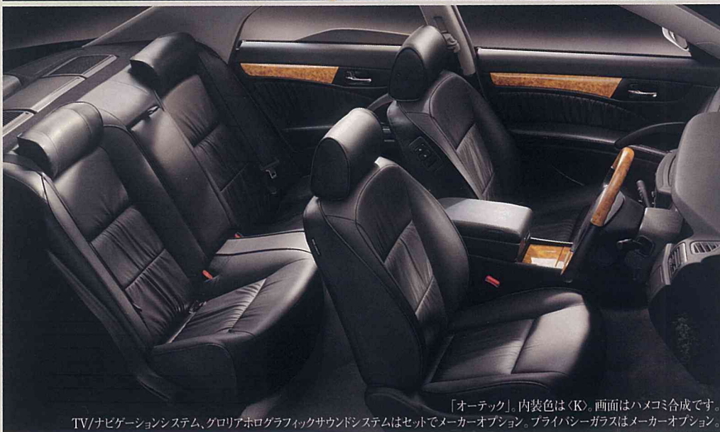
「オーテック」内装色は〈K〉。画面はハメコミ合成です。 TV/ナビゲーションシステム、グロリアホログラフィックサウンドシステムはセットでメーカーオプション。プライバシーガラスはメーカーオプション。