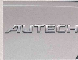
●専用リヤエンブレム