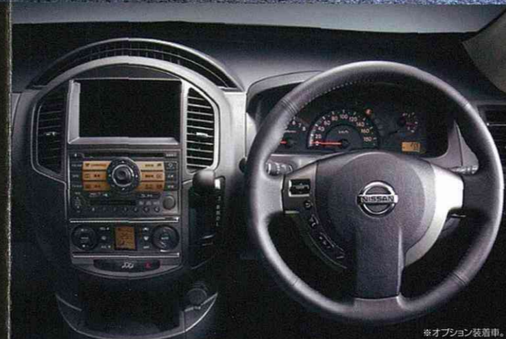
※オプション装着車。