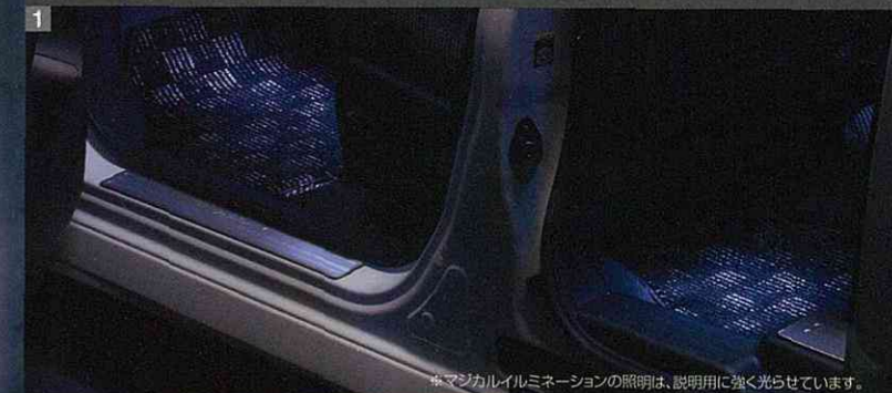
※マジカルイルミネーションの照明は、説明用に強く光らせています。