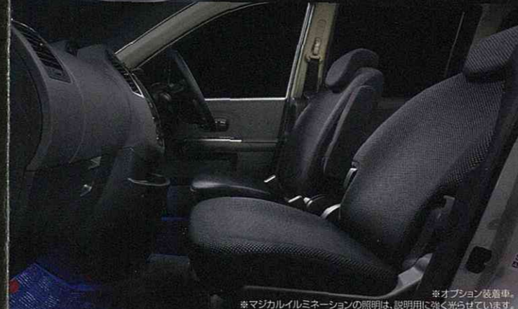
※オプション装着車。 ※マジカルイルミネーションの照明は、説明用に強く光らせています。

ラフェスタ ライダーアルファII メーカー希望小売価格 ライダーアルファII (2WD エクストロニックCVT) (スポーティパッケージ・ブラック内装・パノラミックルーフ有) 2,559,900円 (消費税抜き価格 2,438,000円) ライダーアルファII (2WD エクストロニックCVT) (スポーティパッケージ・ブラック内装・パノラミックルーフ無) 2,486,400円 (消費税抜き価格 2,368,000円)