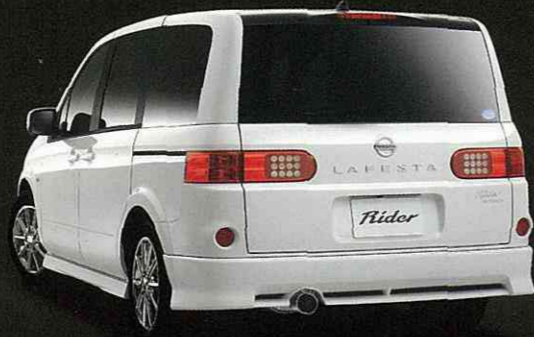
Photo:ラフェスタ「ライダーアルファII」(2WD)。ボディカラーはホワイトパール(3P)〈#OX1・特別塗装色〉。内装色はブラック(G)。オプション装着車。

イルミネーションの色を変化させ、室内を演出するマジカルイルミネーションや ドアの開閉時にロゴが浮かび上がるキッキングプレートのエンブレム。 スタイリッシュなスタイルに新たな価値を加えムーディな夜のインテリアを演出する 「ライダーアルファII」シリーズ。 プレミアム感に満ちたその装いは、昼も夜も、ときめく心と響きあう。