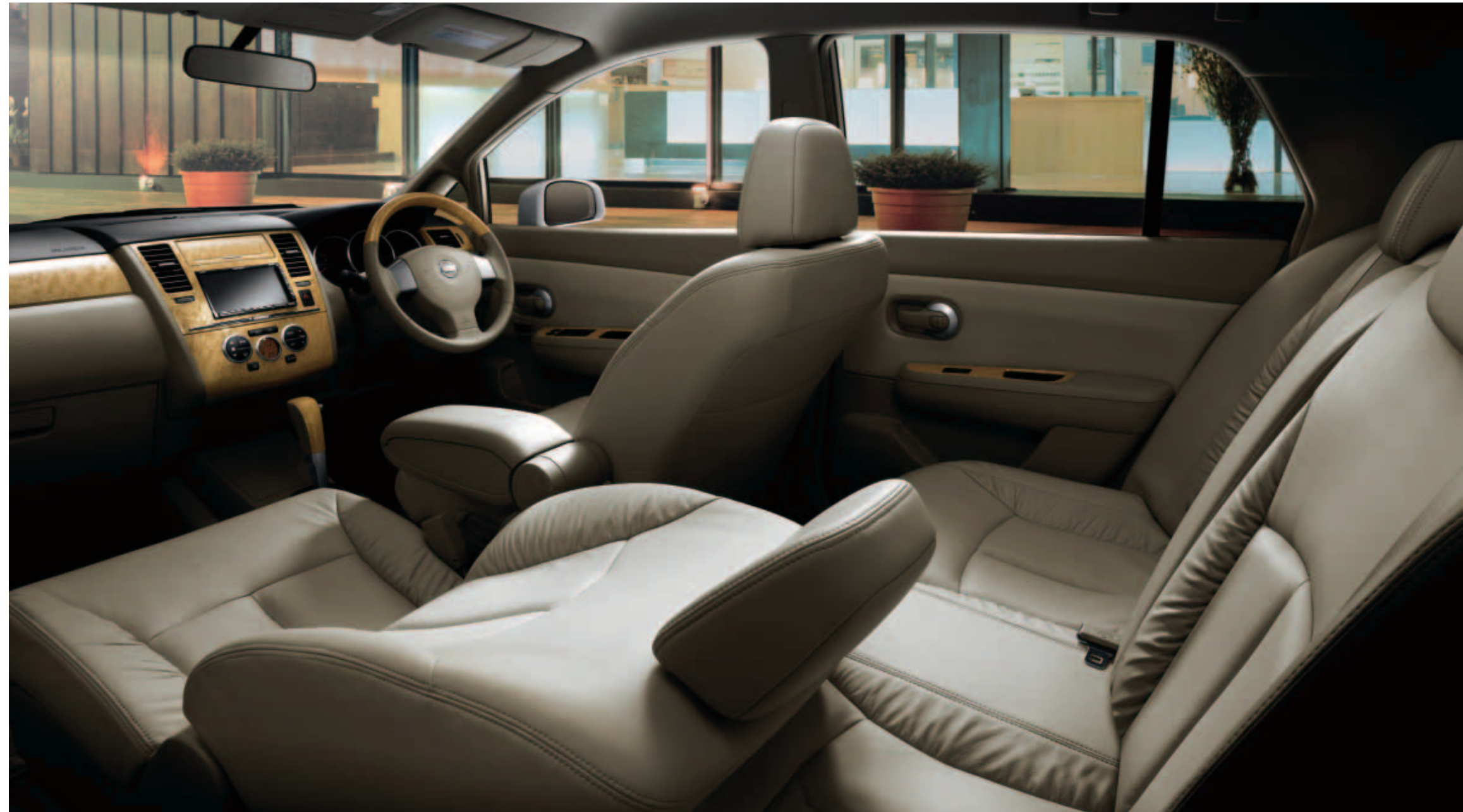
Photo: アクシス(MR18DE・2WD)。ボディカラーはホワイトパール(3P)〈#QX1・特別塗装色〉。内装色はサンドベージュ(C)。インテリジェントキー+エンジン immobilizer+インテリジェントキー連動運転席オートドライビングポジションシートはメーカーオプション。専用HDDナビゲーションシステム+専用スピーカーはオーテック扱いオプション。

そのインテリアは、ふたりの時間を上質なやすらぎで満たすためにコーディネートされました。サンドベージュの本革シートと色調を合わせたドアトリム。本革と木目調のコンビステアリング、木目調のパネルやシフトノブ。そこは、トラディショナルな美しさと本物だけが持つ心地よさが漂う空間です。そして、落ち着いた佇まいを感じさせるフロントグリルやフロントバンパー。きらりと輝くフードトップモールとウエストメッキモール。足元をひきしめるアルミホイールなど、そのエクステリアにもプレミアムなクオリティを求めました。本当の豊かさを知る大人のふたりに。ラティオ「アクシス」