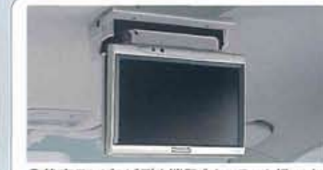
●後席テレビ&ビデオ端子〔オーテック扱いオプション〕