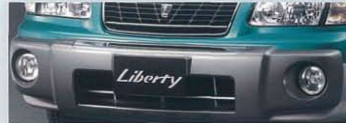
●専用フロントオーバーライダー&専用フロントフォグランプ(※)