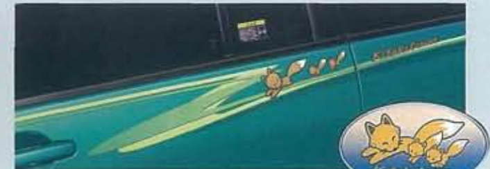
●専用ボディサイドストライプ&専用ネーミングステッカー