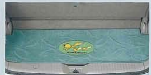
●専用ラゲッジフロアカーペット