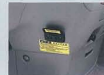
●電源コンセント(AC100V・100W)