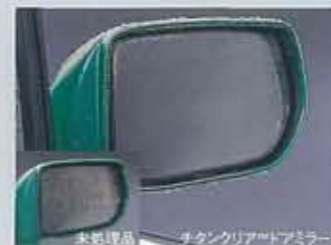
●専用チタンクリア™ドアミラー