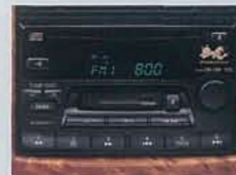
●専用CD・カセット一体AM/FM電子チューナーラジオ(ダークスケルトンタイプ)