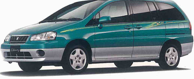
Photo:キタキツネ 専用フロントオーバーライダー無車(2WD)。 ボディカラーはメディタラニアングリーン(M) / プラチナシルバー(M) (#3W2) (特別塗装色)。 ルーフレールはメーカーオプション。