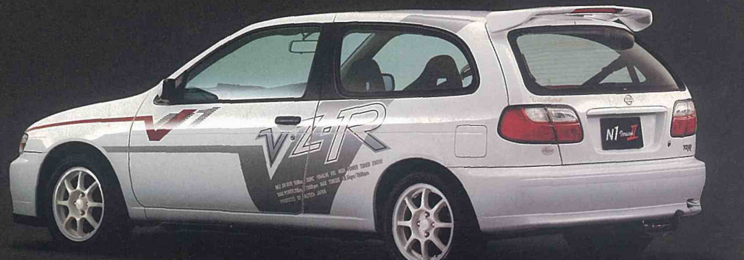
PHOTO: VZ-R・N1 Version II。ボディカラーはホワイト(＃QM1)。専用15インチアルミロードホイール、専用大型ボディサイドストライプ、専用大型ルーフスポイラーはオーテックジャパン扱いオプション。

●低回転域と高回転域のそれぞれに、最適なバルブタイミングとリフト量を設けた2種類のカムを、それぞれに切り替えて制御するシステムです。すべての回転域で出力を効果的に引き出せる驚異的なエンジンで、ストレートからコーナリングまで圧倒的な速さを発揮します。 ●200PS専用のシリンダーヘッド、吸排気に加えて①クランクシャフト、フライホイールのバランス取り ②ポート研磨 ③燃焼室研磨 ④吸排気マニホールド研磨を更に追加しています。 ●このエンジンの性能をフルに引き出し、走りの良さを常に体感していただくために、燃料は必ず無鉛プレミアムガソリンをご使用ください。