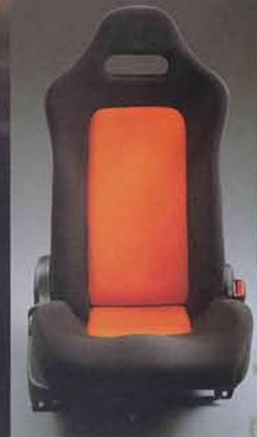
■専用モノフォルムバケットシート