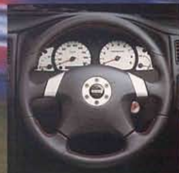
■MOMO製本革巻スポーツステアリング