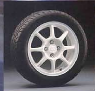
■205/50VR15 5576タイヤ (DUNLOP製FORMULA W-10) 専用15インチアルミロードホイール (ENKEI製) オーテックジャパン扱いオプション