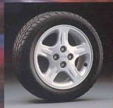
■205/50VR15 5576タイヤ (DUNLOP製FORMULA W-10) 615インチアルミロードホイール

このマシンと語り合った時、追従するライバル達の無意味さを、知ることになるだろう。