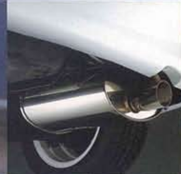
■専用メインマフラー (フジツボ技研製)