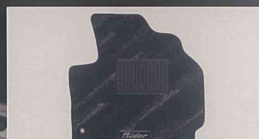
専用フロアカーペット