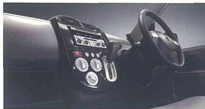
Photo:オッティ ライダー 10th アニバーサリー（2WD）〈4AT〉。内装色はブラック〈K〉。専用サウンドシステム+iPod*アダプター+リヤスピーカーはオーテック扱いオプション。

●RX/RX FOUR、RS/RS FOURと同仕様です。標準車カタログも合わせてご覧ください。 ※ライダー 10th アニバーサリーはエアロパーツ装着のため、緑石や段差の大きい場所や不整地等で路面などと干渉する場合がございます。 ●あらかじめ承諾をください。 ●本車間は持込による届出でオーテック扱いとなります。