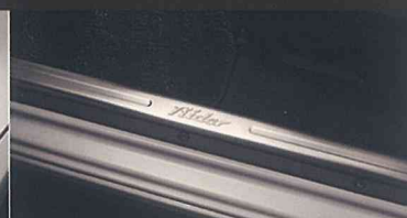
専用キッキングプレート (前席のみ。「Rider」ロゴ付。)