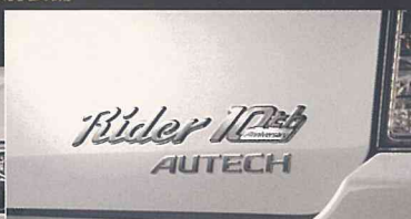
ライダー 10th アニバーサリー エンブレム