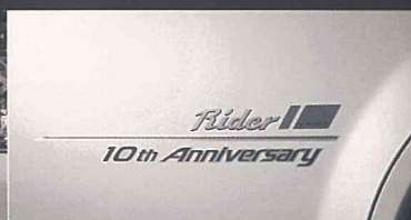
専用ボディサイドグラフィック