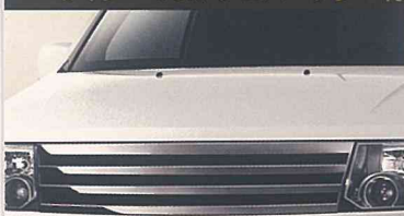
専用フロントグリル (スモーク)