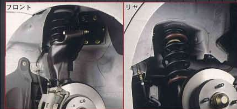
■専用サスペンション 専用スプリングを採用。