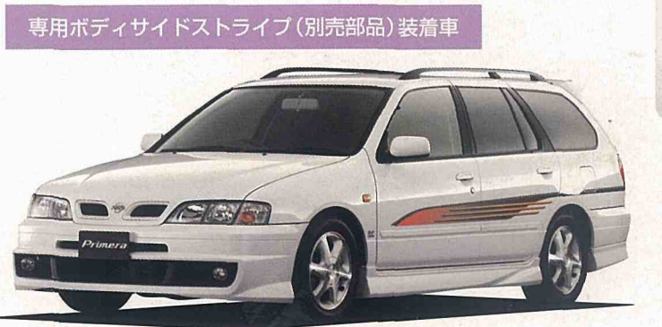
Photo: エアロスポート(2.0G-V)。ボディカラーはプラチナホワイトパール(3P) <#QN0> 特別塗装色。専用ルーフスポイラーはオートテックジャパン扱いオプション。

●このカタログのエンジン出力表示はすべて「ネット値」です。 ●エンジン出力表示には、ネット値とグロス値があります。「グロス」はエンジン単体で測定したものであり、「ネット」とはエンジンを車両に搭載した状態とはほぼ同条件で測定したものです。同じエンジンで測定した場合、「ネット」は「グロス」よりもガソリン自動車で約15%程度低い値(自工会調べ)となっています。 ※SR20VE(NEO VVL)エンジン搭載車、SR20DEエンジン搭載車には無鉛プレミアムガソリンをご使用下さい。なお、無鉛プレミアムガソリンが入手できない場合、無鉛レギュラーガソリンも使用できますが、エンジン出力低下等の現象が発生します。 ●本車両は持ち込み登録で、(株)オートテックジャパン扱いとなります。