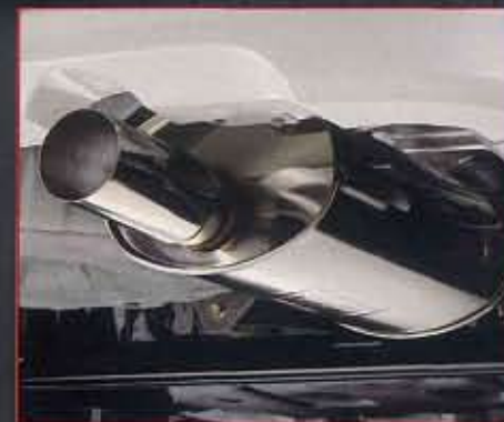
■専用メインマフラー(フジツボ技研製)