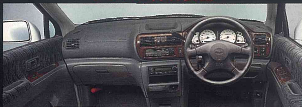
●本革巻4本スポークステアリング(抗菌仕様、スポーツタイプ) ●専用ホワイトメーター ●木目調パネル