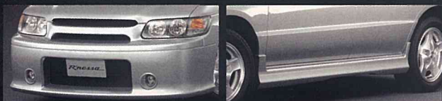
●専用フロントスミージングバンパー ●専用サイドシルプロテクター ●専用フロントグリル(バンパー一体型) ●専用フォグランプ(CIBIE製)