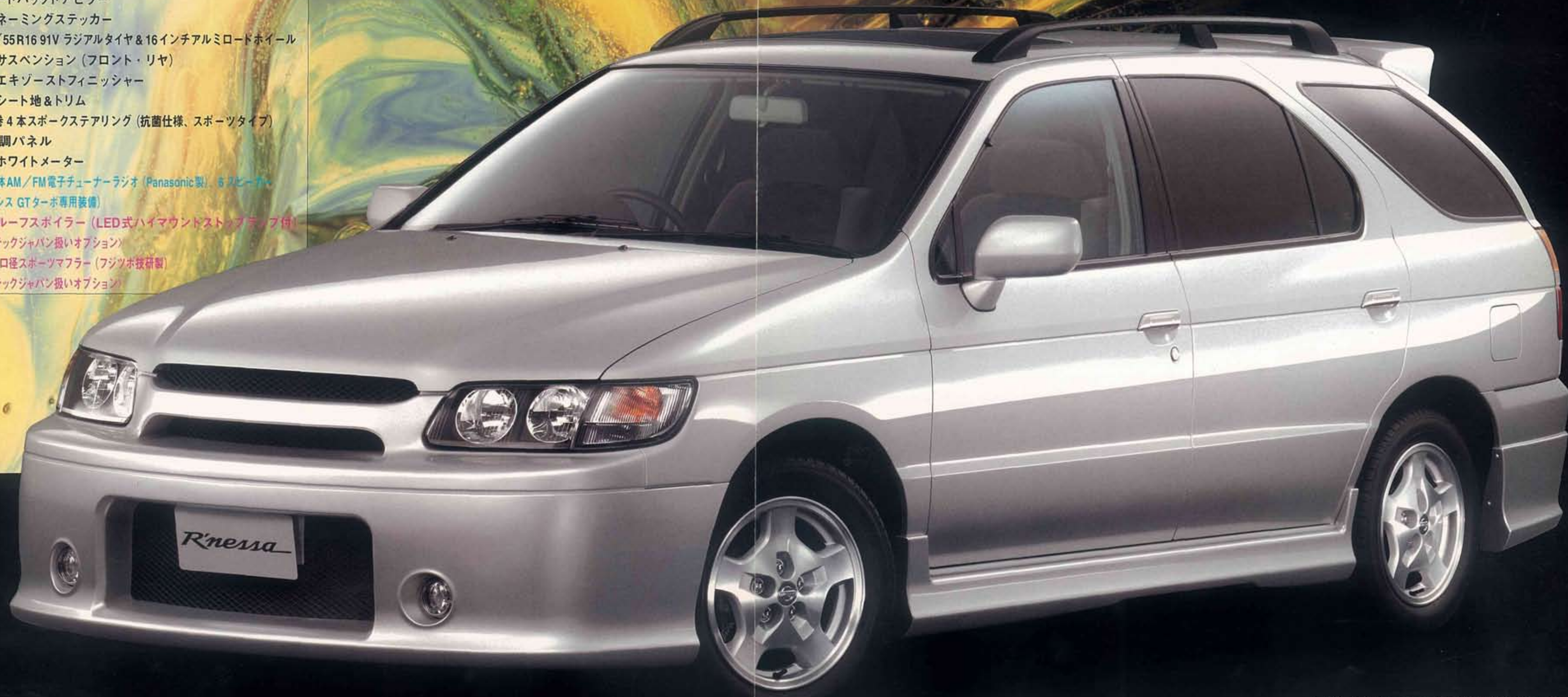
PHOTO: アクシス (2WD 2000)。ボディカラーはプラチナシルバー (MK=KL0)。電動ガラスサンルーフ、プライバシーガラスはメーカーオプション。専用ルーフスポイラーはオーテックジャパン扱いオプション。