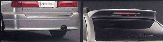
●専用リアアンダースポイラー ●専用ルーフスポイラー(LED式ハイマウントストップランプ付) <オーテックジャパン扱いオプション>