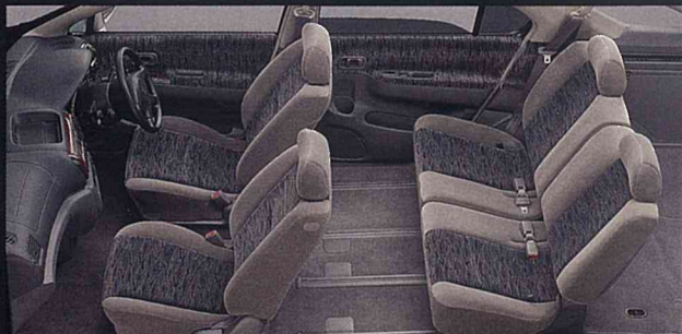
●専用シート地&トリム