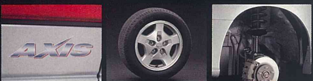
●専用ネーミングステッカー ●215/55R16 91Vラジアルタイヤ&16インチアルミロードホイール ●専用サスペンション(フロント・リヤ)スプリング、ショックアブソーバー変更(但し4WD車のリヤショックアブソーバーのみ変更) ※写真はフロントサスペンション(2WD 2000)