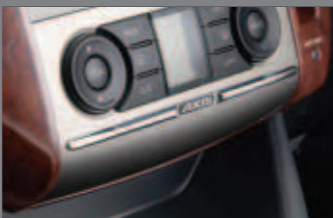
専用インストモール