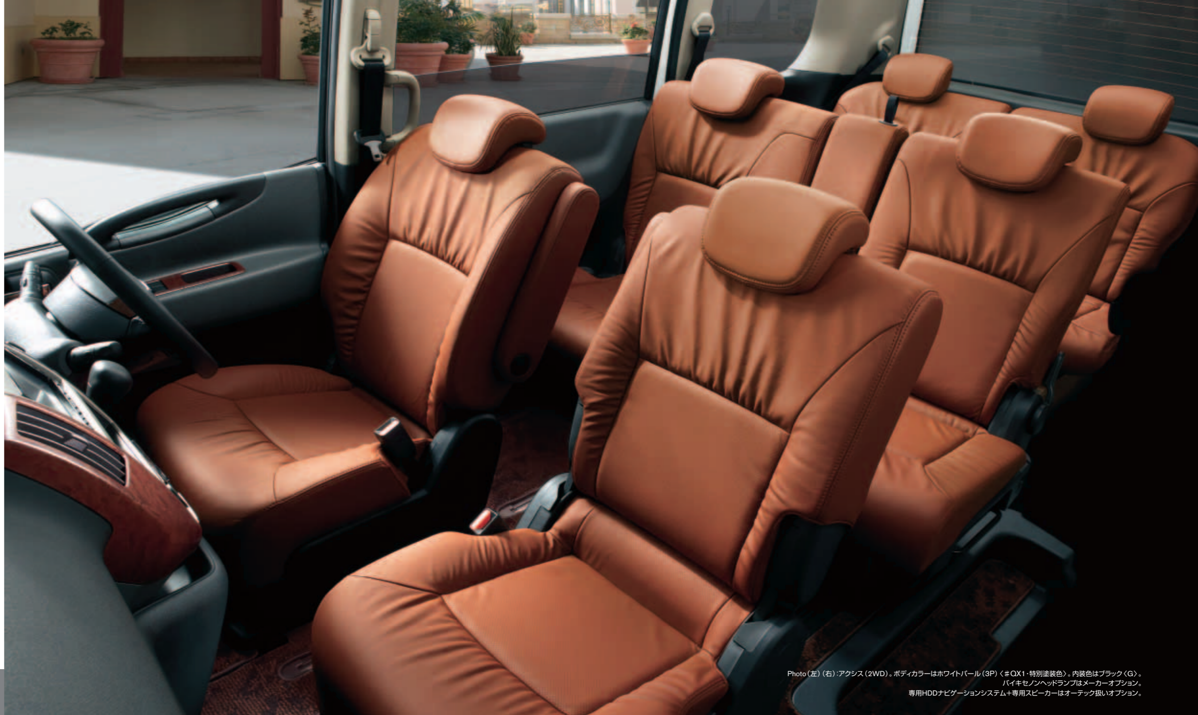
Photo (左) (右): アクシス (2WD)。ボディカラーはホワイトパール (3P) <# OX1・特別塗装色>。内装色はブラック (G)。 バイキセンヘッドランプはメーカーオプション。 専用HDDナビゲーションシステム+専用スピーカーはオーテック扱いオプション。