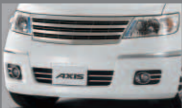
専用フロントグリル/専用フロントバンパー