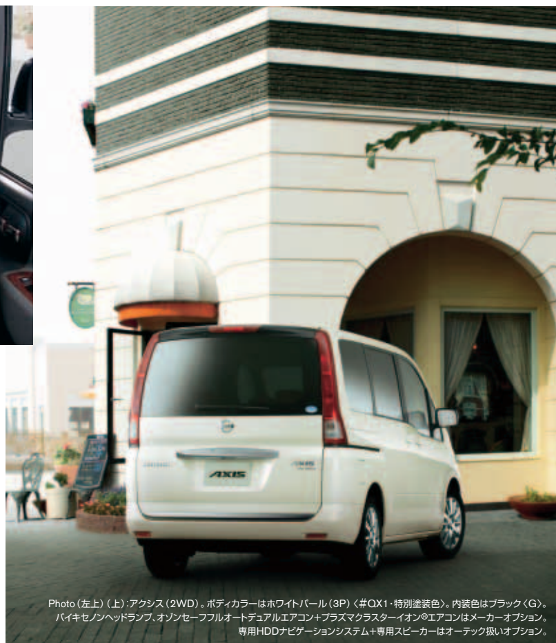
Photo (左上) (上):アクシス(2WD)。ボディカラーはホワイトパール(3P)〈#QX1・特別塗装色〉。内装色はブラック〈G〉。ハイキセノンヘッドランプ、オゾンセーフフルオートデュアルエアコン+プラスマクラスターイオン®エアコンはメーカーオプション。専用HDDナビゲーションシステム+専用スピーカーはオーテック扱いオプション。

高級・上質感あふれる乗り心地のため、サスペンションのチューニングからタイヤの選定に至るまで、トータルな変更をアクシス専用に施しました。