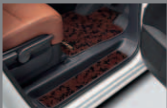
専用フロアカーペット/専用ステップカーペット