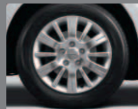
専用16インチアルミホイール/ 専用195/60R16 89Hタイヤ