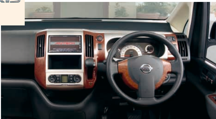
■インストルメントパネル