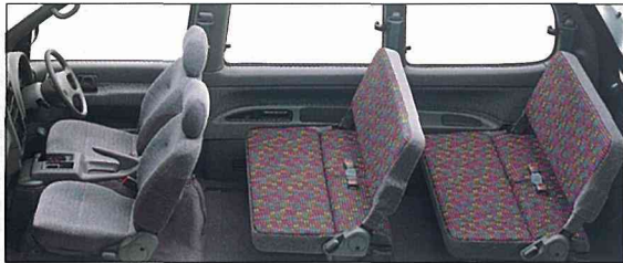
●セカンド・サードシートともゆりの2人乗り。目的地までラクラク。

2WDアーバンリゾート(ディーゼラーボ2000) ボディカラーはフォレストグリーンP/ガングレーGP(≒3N9)特別塗装色専用オプション装着車。小物類は撮影用のための小道具です。