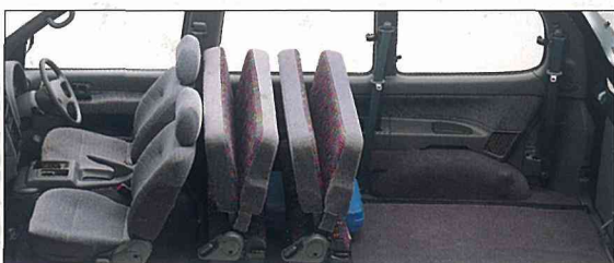
●シートを折りたたむとビッグなスペースが出現。大きなレジャーグッズもOKです。