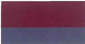
●ラズベリーレッドP/ガングレーGP(#4N2)*