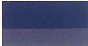
●ダークブルーGP/ガングレーGP(#4N1)*

Mはメタリック、Pはパール、GPはグラファイトパール、TPMはマイクロチタンパールメタリックの略です。 *は特別塗装色です。