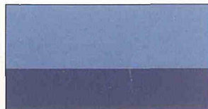
●ライトバイオレットTPM/ガングレーGP(#3N8)*