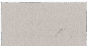
●プラチナシルバーM(#KL0)