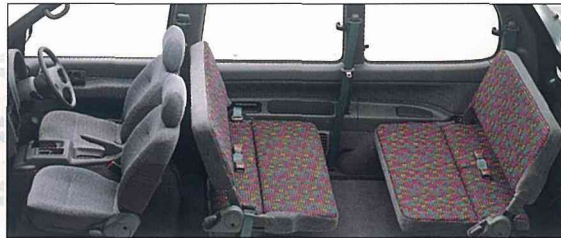
●向き合えば、会話がはずみ、心がかようリビングルームになります。