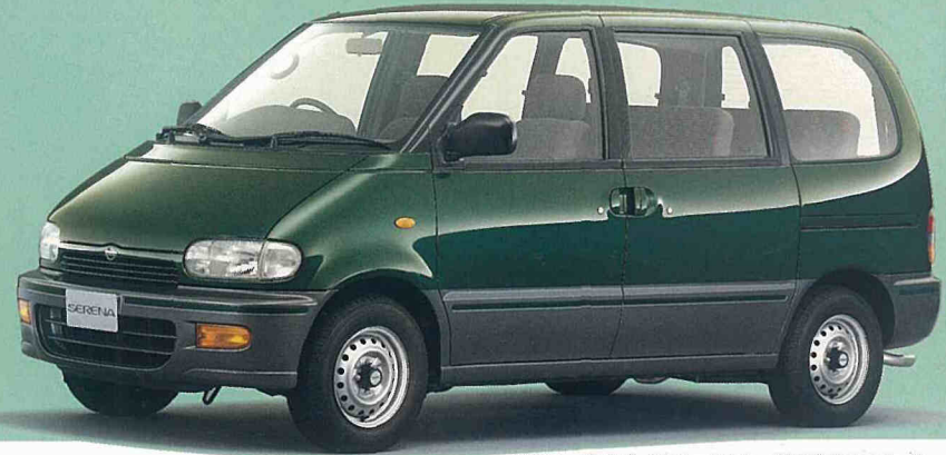
2WDアーバンリゾート(ディーゼラーボ2000)ボディカラーは フォレストグリーンP/ガングレーGP(#3N9)特別塗装色