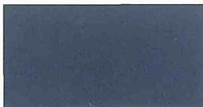
●パールリッシュグレーGP(#LK5)