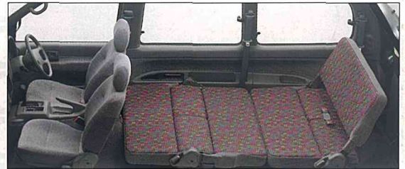
●セカンドシートを倒すと、とてもリラックス。足を伸ばしてゆったりと。