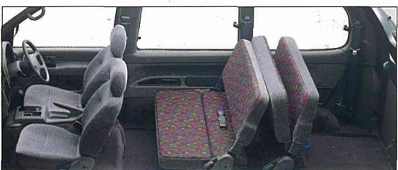
●サードシートを折りたたむとカーゴスペース。4人乗って、荷物も運べます。

写真は2WDアーバンリゾート。シートをフラットの状態で行かないでください。なお、小物類は撮影用のための小道具です。