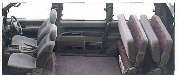
●スライドドアを開くとカーゴスペース。サイドからの積みおろしも容易です。

* シートアレンジは一例です。あなたのアイデアや使い勝手で独自のアレンジをお楽しみいただけます。