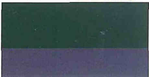
●フォレストグリーンP/ガングレーGP(#3N9)*