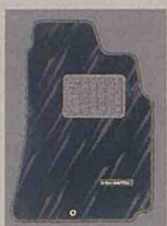
専用フロアカーペット