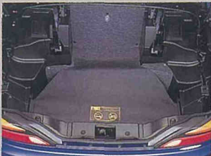
トランクスクリーン