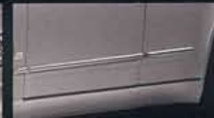
●カラードサイドシル&カラードサイドガードモール