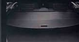
●トノカバー(ラゲッジアンダーボックス格納タイプ) ※