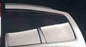
●プライバシーガラス(UVカット断熱機能付) (リヤドア・リヤサイド・バックドア) ※