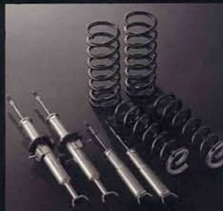
●専用サスペンション(専用スプリング&ショックアブソーバー) ●リヤカラードバンパー