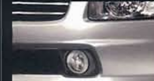
●フロントフォグランプ(フロントエアロフォルムバンパー用)