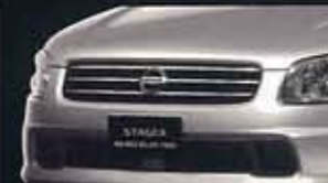
●フロントエアロフォルムバンパー