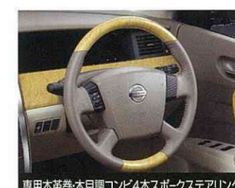
専用本革巻木目調コンビ4本スポークステアリング