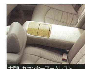
大型リヤセンターアームレスト