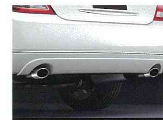
専用エキゾーストフィニッシャー(ダブルタイプ)