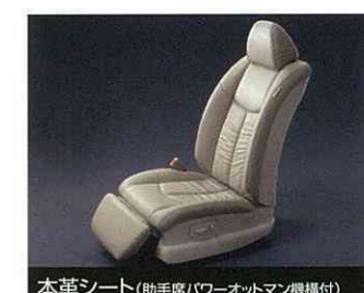
本革シート(助手席/パワーオットマン機構付)