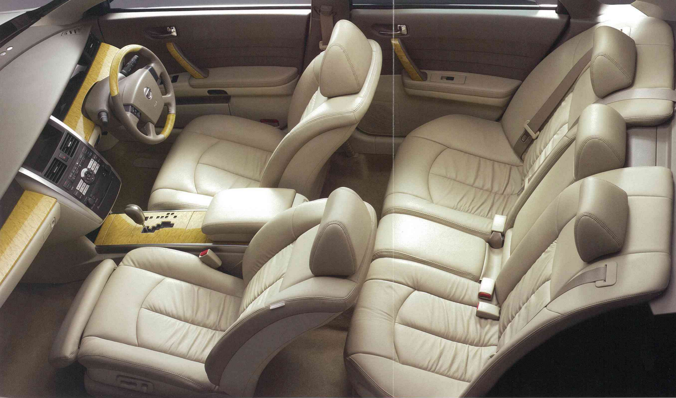
Photo:アクシスVQ23DE。内装色はカシミア<C>。●インテリジェントキー&エンジンイモビライザー&メッキ/カラーコンビドアハンドル、カーウイングス対応TV/ナビゲーションシステム(DVD方式)&ステアリングスイッチはメーカーオプション。