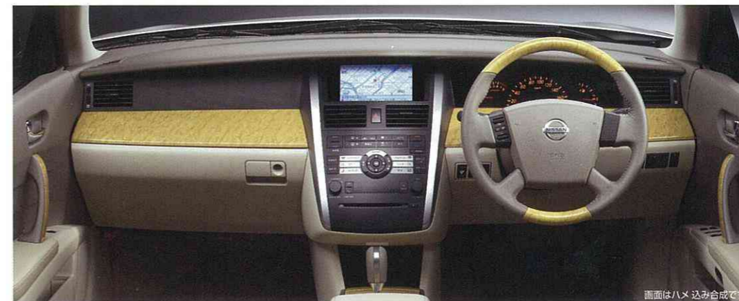
画面はハメ込み合成です。

最上の機能とデザインに 高級感をプラスした本革シート。 足を伸ばしてくつろぐ時、 心地よさの次元が変わります。