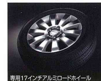
専用17インチアルミロードホイール