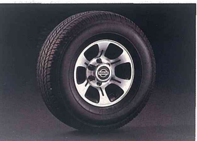
ワイドR3Mアーバン AJリミテッド用アルミロードホイール

(注)「リヤスポイラー無車」の設定もあります。なお、リヤスポイラーはご注文後の取付けはできませんのでご了承ください。