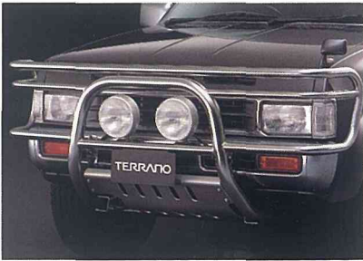
専用ステンレス製フロントグリルガード&アルミ製フロントアンダーガード&フォグランプ