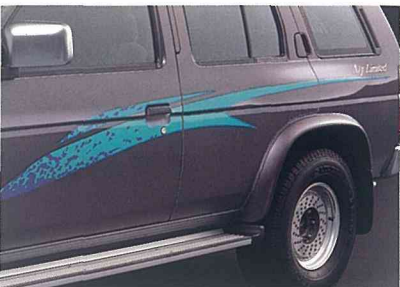
専用ボディサイドストライプ