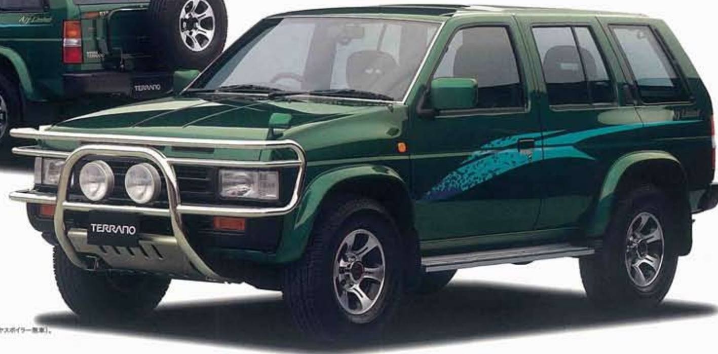
Photo: TURBO ワイドR3 M アーバンAJリミテッド(リヤスポイラー付車)、 ボディカラーはフォレストグリーン(2P) (C8101)。