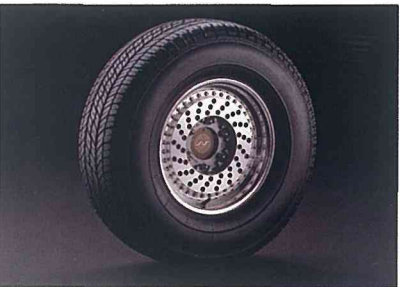
ワイドR3M AJリミテッド専用アルミロードホイール