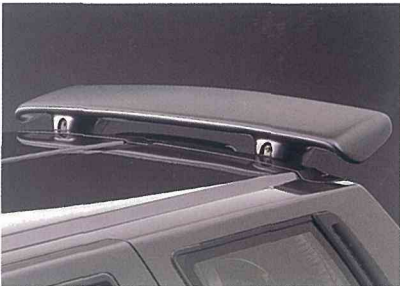
リヤスポイラー(注)