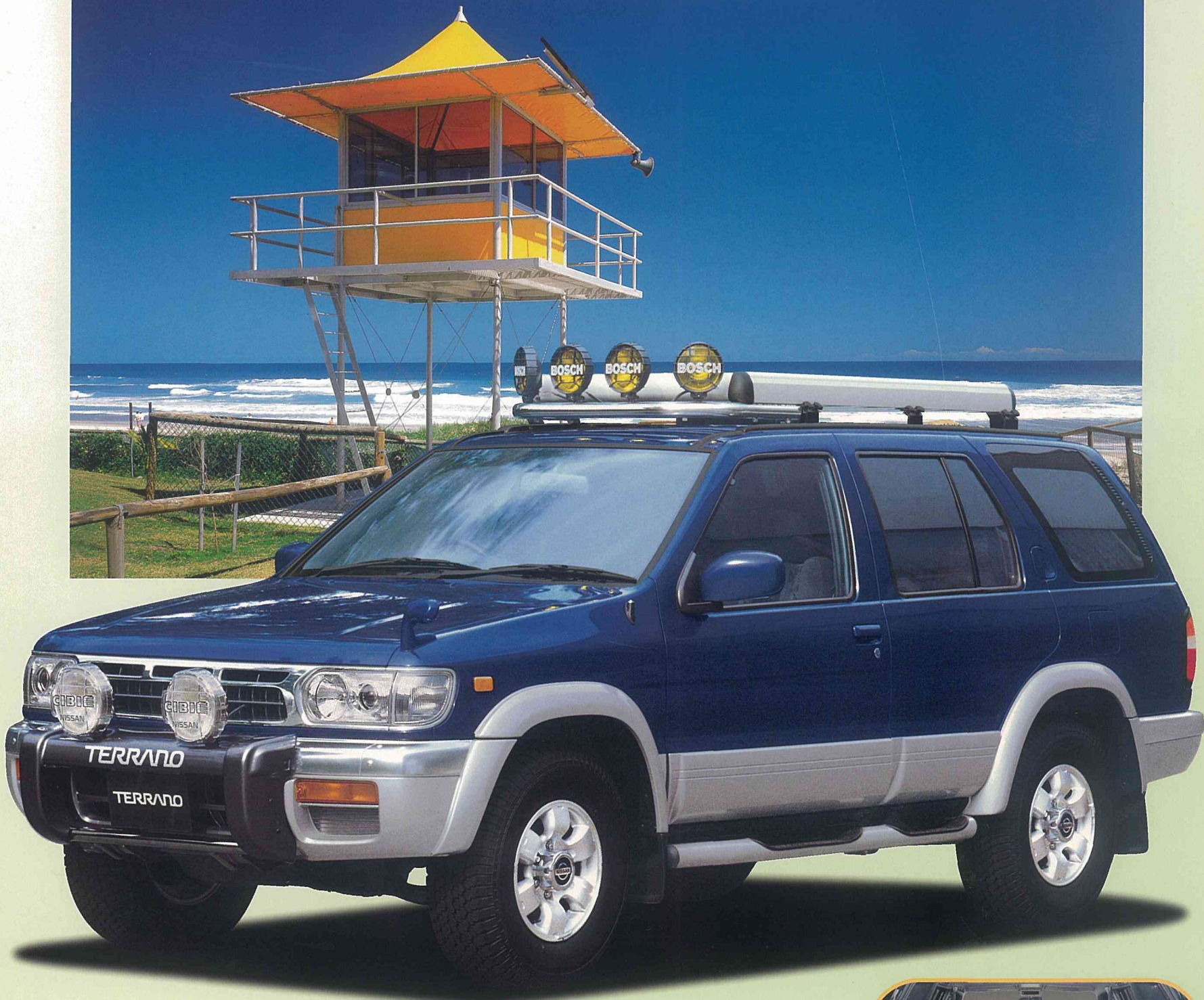
Photo:「フィールドベース」V6-3300ガソリンワイドR3 TM -R。ボディカラーはダークブルー(P)/ソニックシルバー(M)ツートーン(≠MT4)。 電動ガラスサンルーフ(スライド・チルトアップ)はメーカーオプション。樹脂製ファッションガード、大型フォグランプ、ヘビーデューティトラック、 ワーキングランプバー、ワーキングランプは日産純正ディーラーオプション。