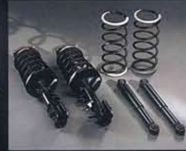
●専用ローハイトサスペンション (フロント・リヤ:スプリング変更・10mmローダウン)