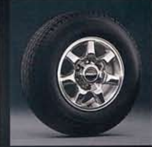
●255/65R16 109Sラジアルタイヤ+専用光輝「フラッドレー」アルミロードホイール(16×8JJ)