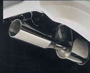
●専用大口径スポーツマフラー(フジツボ技術研製) (専用メーカーオプション)