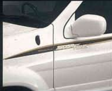
●専用ボディサイドストライプ&専用ネーミングステッカー(カーボン調)