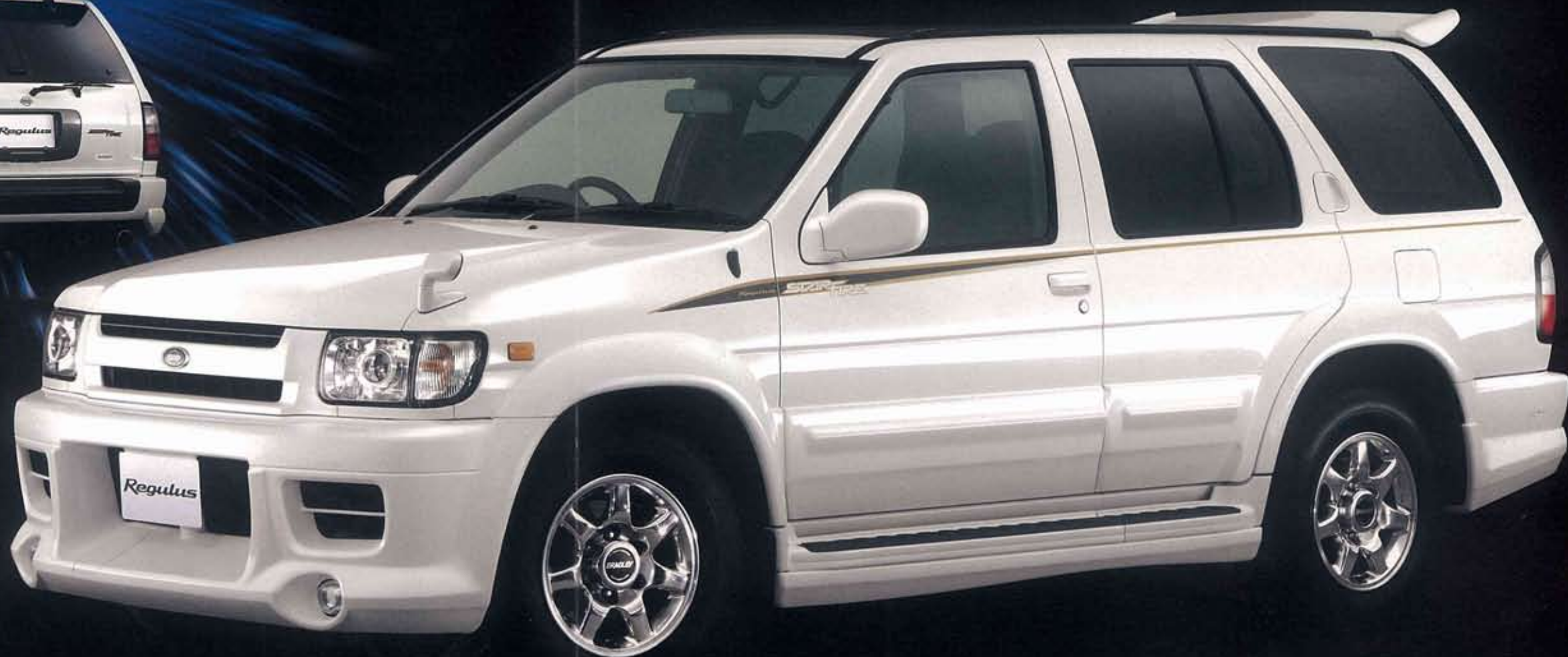
Photo:レグラス 3000インタークーラー・手置増ディーゼル「スターファイア」。ボディカラーはホワイトパール(3P) (≠OX1・特別塗装色)。