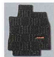
7. 専用フロアカーペット