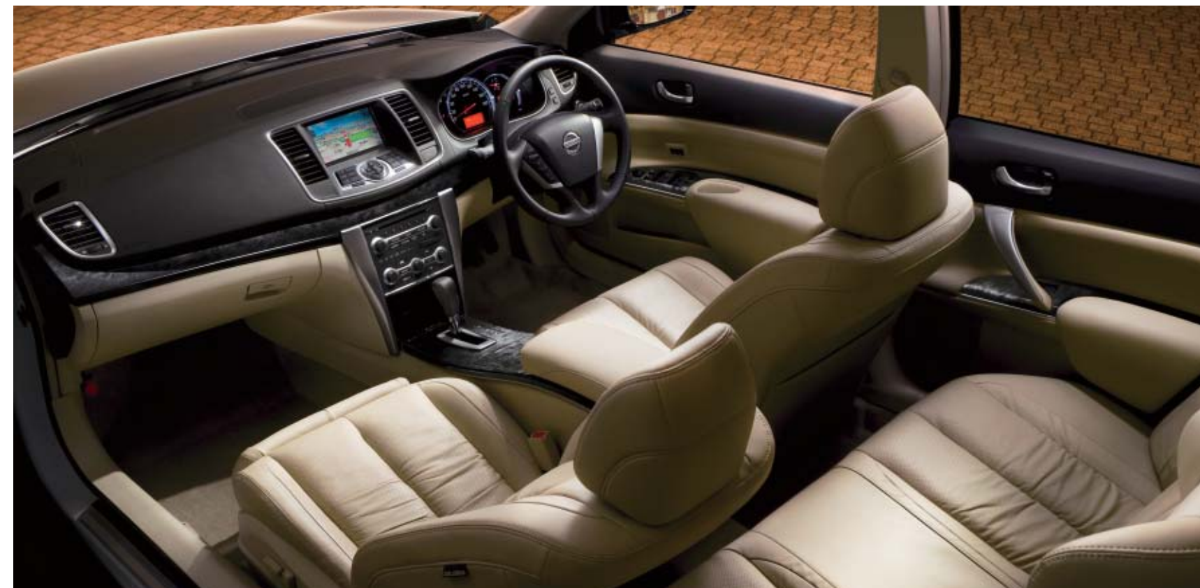
Silky Ecru Interior