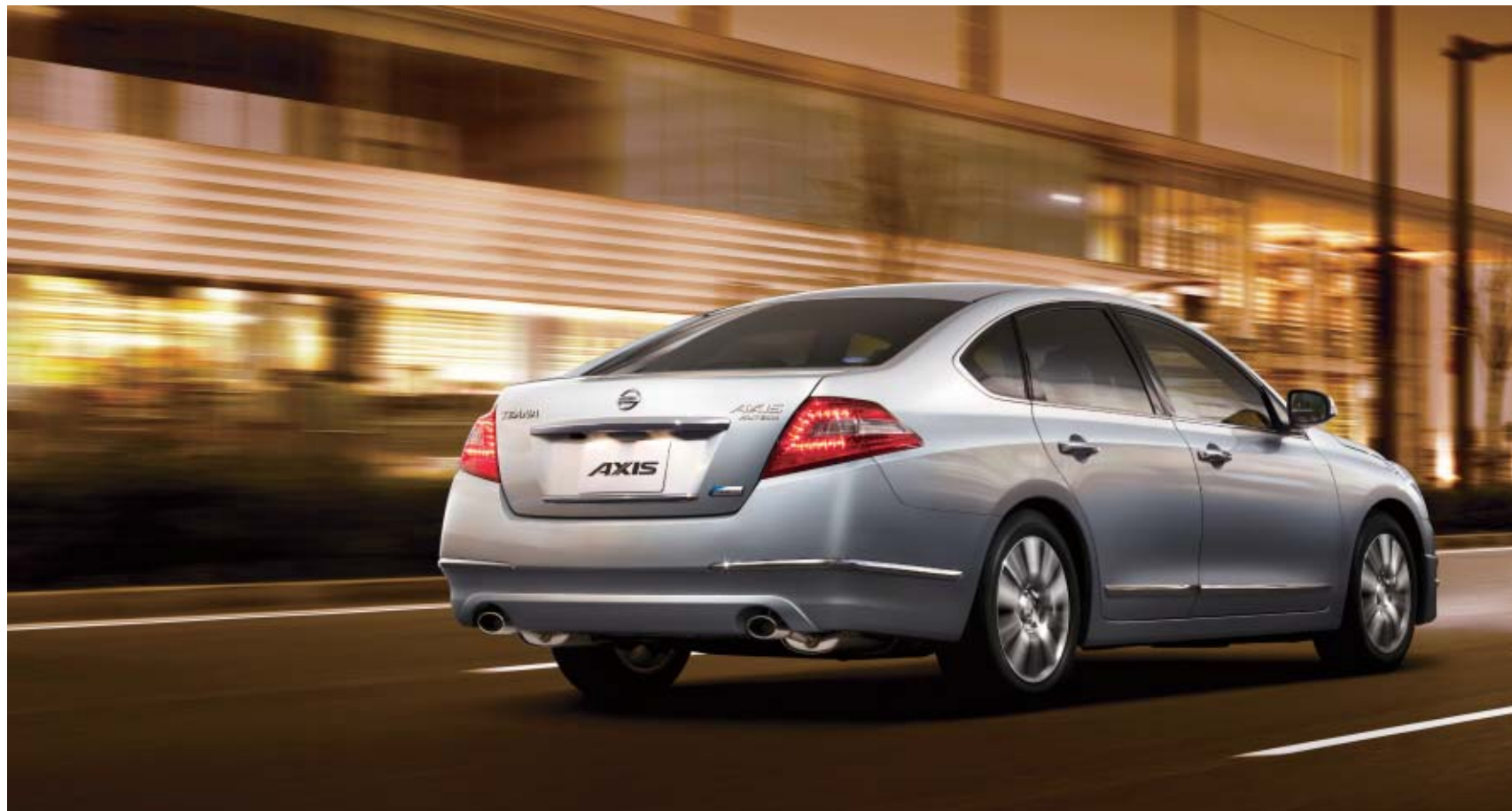
Photo:アクシス(2WD-VQ25DE)。ボディカラーはプリリアントシルバー(M)〈#K23〉。カーウイングスナビゲーションシステム(HDD方式)+ステアリングスイッチ+バックビューモニター+サイドブラインドモニター、プライバシーガラスはメーカーオプション。