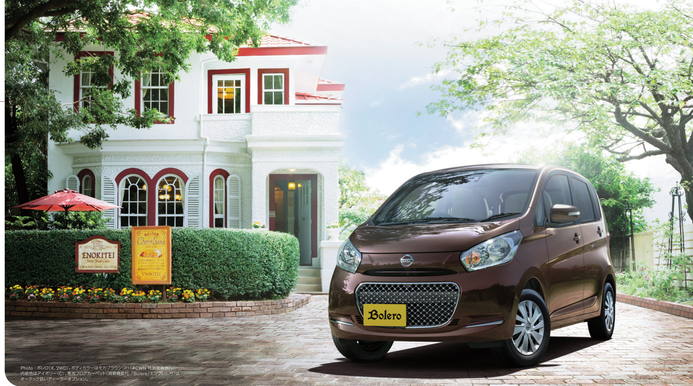
Photo: ボレロ(X, 2WD)。ボディカラーはモカブラウン(P)(<#CWN 特別塗装色>。内装色はアイボリー(C)。専用フロアカーベット(消臭機能付、「Bolero」エンブレム付)はオーテック扱いディーラーオプション。