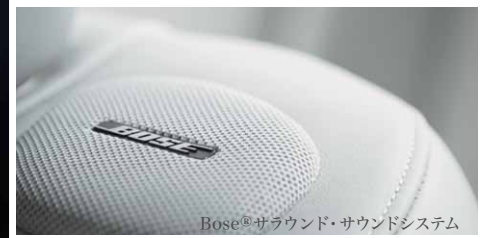
Bose® サラウンド・サウンドシステム