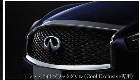
ミッドナイトブラックグリル〈Cool Exclusive専用〉