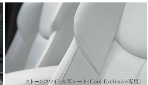
ストーンホワイト本革シート〈Cool Exclusive専用〉