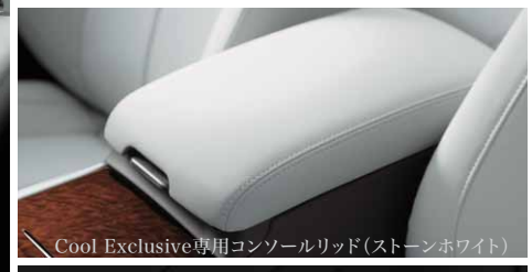
Cool Exclusive専用コンソールリッド(ストーンホワイト)