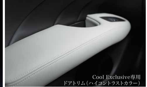
Cool Exclusive専用 ドアトリム(ハイコントラストカラー)