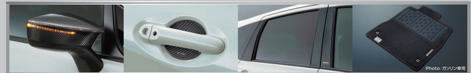
カーボンアミラーカバー