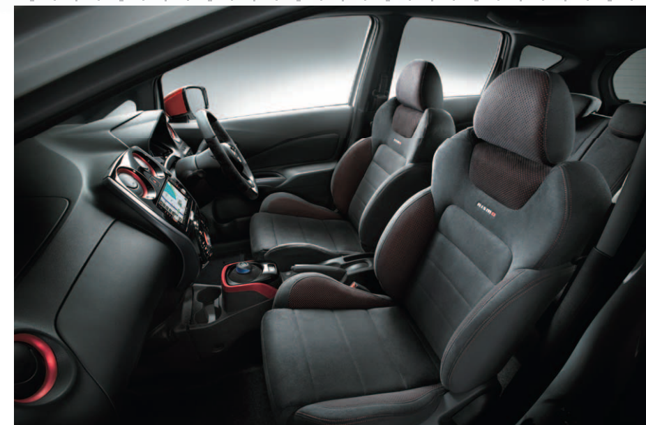
Photo: ノート e-POWER NISMO。ボディカラーはプリアnantホワイトパール(3P)(#QAB)(特別塗装色)。内装色はブラック(G)。LEDヘッドランプ(ロービーム、オートレベライザー付、プロジェクタータイプ、LEDポジションランプ付)はメーカーオプション。インテリジェントアラウンドビューモニター(移動物 検知機能付)+スマート・ルームミラー(インテリジェントアラウンドビューモニター表示機能付)+踏み間違い衝突防止アシスト+フロント&バックソナー+ヒーター付ドアミラーはセットでメーカーオプション。日産オリジナルナビゲーションはディーラーオプション。*「ノート e-POWER NISMO」は持込み登録でオーテック扱いとなります。*画面はハメ込み合成です。*装備・仕様の詳細は裏表紙の主要装備一覧をご覧ください。