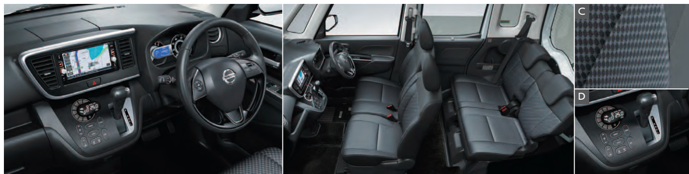
Photo:ライダー Gターボ(2WD・インタークーラーターボ)。ボディカラーは、左からオーシャンブルー(P)〈#SMB〉、ブラック(P)/クールシルバー(M)専用2トーン〈#FMV〉(特別塗装色)、ホワイトパール(3P)/ブラック(P)2トーン〈#FMS〉(特別塗装色)、チタニウムグレー(M)〈#TRN〉、スパークリングレッド(M)〈#RMR〉。内装色はエボニー(G)。専用フロアカーペット(消臭機能付、「Rider」エンブレム付)はオーテック扱いディーラーオプション。 ※メーターなどの表示は機能説明のためのイメージ画像です。 ※画面はハメ込み合成です。

BODY COLOR ライダー専用2トーンをはじめ、個性を彩るボディカラーラインアップ。