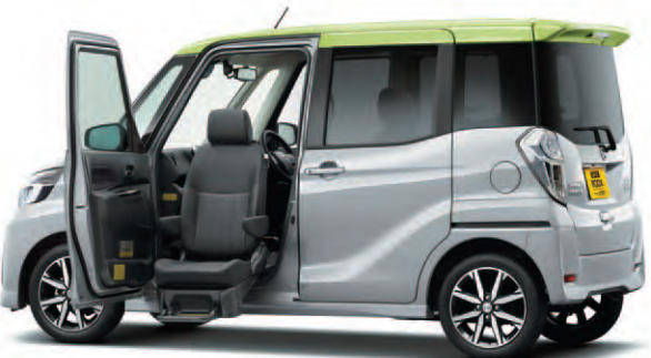
Photo:ハイウェイスター-X Gパッケージ 助手席スライドアップシート。ボディカラーはエアグレイ(PM)/レモンライム2トーン(＃FMY)(特別塗装色)。内装色はエボニー(G)。

リモコンひとつで簡単操作。 シートが電動で回転・昇降します。 車いすをお使いの方でも楽に乗り降りできます。