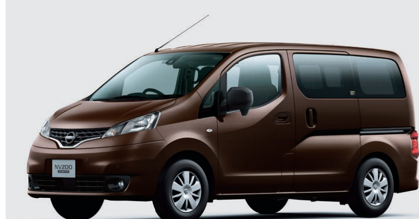
Photo:バンGX(2WD)。ボディカラーはインベリアルアンバー(P)(#CAS)(特別塗装色)。内装色はブラック/グレー(W)。フォグランプはメーカーオプション。

バンGXマルチベッドなら、機能性・快適性を追求した、専用の架装オプションを多数ラインアップ。 4WD車では、さらに遊びの行動範囲が広がります。