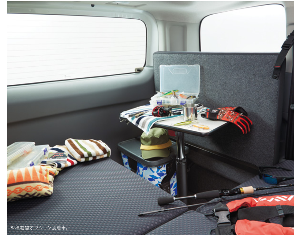
※積載物オプション装着車。