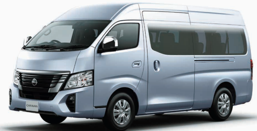
Photo : ワゴン ワイドボディ(2WD・ガソリン)。スーパーロングボディ・ワイド幅・ハイルーフ・低床 10人乗 4ドア。ボディカラーはブリリアントシルバー(M) (#K23)。

スーパーロングワイド車型と10人乗ワゴンの組み合わせで人と荷物の送迎を両立し、大きいスーツケースも5個積みます。ホテル、旅館などの送り迎えに最適です。