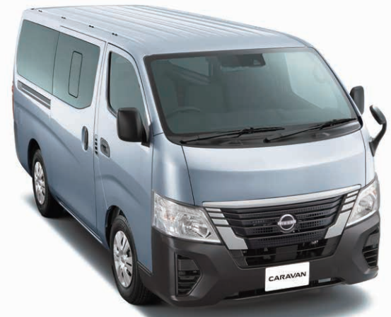
Photo : DX 2分割上級セカンドシート(2WD・ガソリン)。ロングボディ・標準幅・標準ルーフ・低床 5ドア。ボディカラーはブリリアントシルバー(M) (#K23)。

セカンドシートが5:5分割式なので、1人座っても長尺物を積載することが可能です。さらに両側のウインドウに、スライドサイドウインドウを標準装備し、後席をより快適にしています。